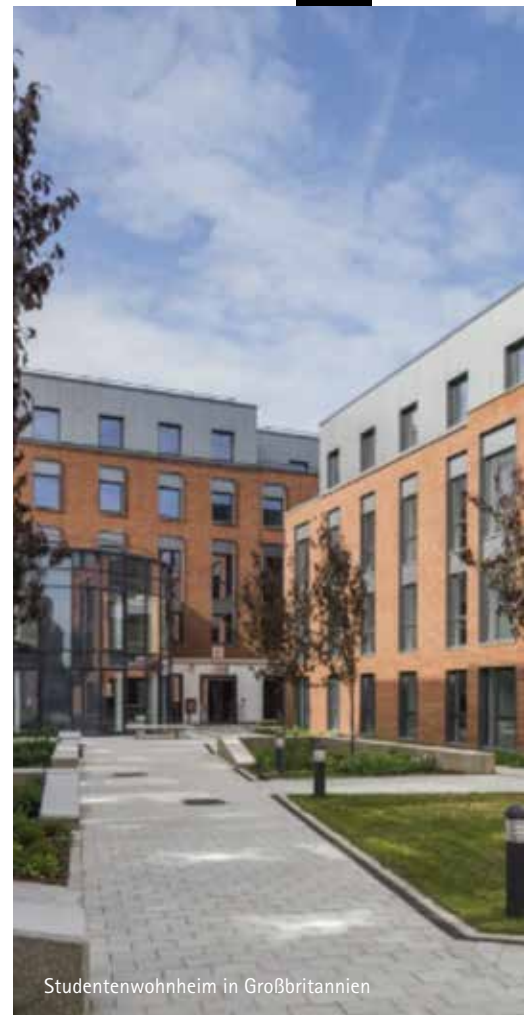
Studentenwohnheim in Großbritannien