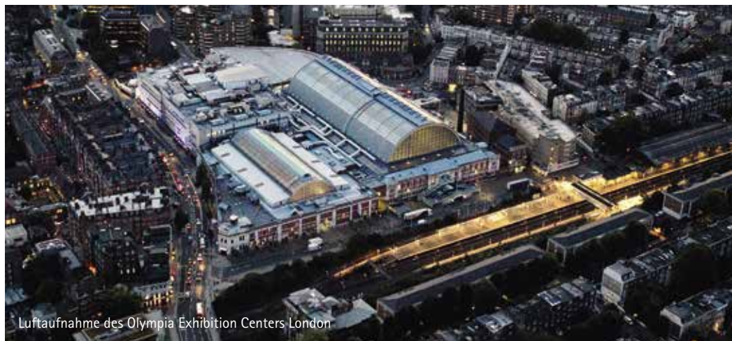
Luftaufnahme des Olympia Exhibition Centers London