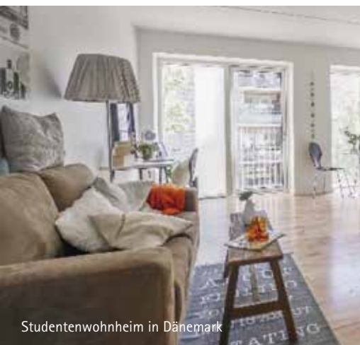
Studentenwohnheim in Dänemark