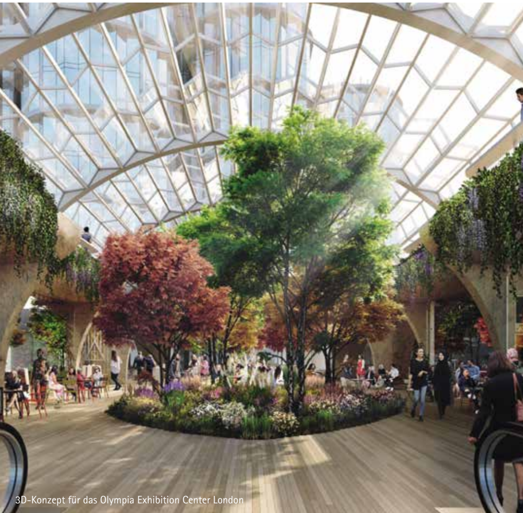
3D-Konzept für das Olympia Exhibition Center London