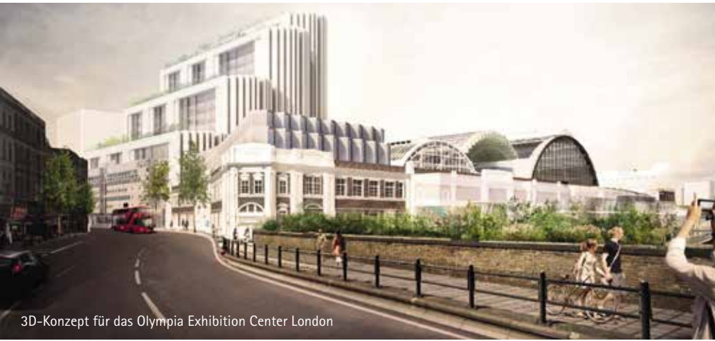
3D-Konzept für das Olympia Exhibition Center London