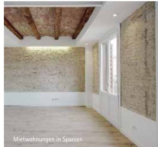
Mietwohnungen in Spanien