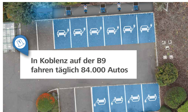
In Koblenz auf der B9 fahren täglich 84.000 Autos