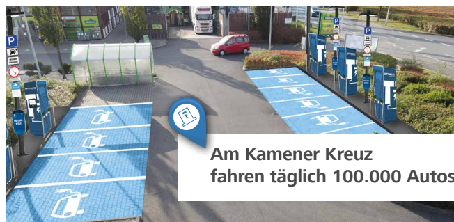
Am Kamener Kreuz fahren täglich 100.000 Autos

2 Schnellladeparks an hochfrequentierten Standorten hat die Fondsgesellschaft bereits als Startportfolio erworben. In Kamen und Koblenz entstehen Ultra-Schnellladeparks mit je 5 Ladesäulen und 10 Ladepunkten. Elektroautos können hier in kurzer Zeit Reichweite nachtanken. In der unmittelbaren Nachbarschaft befinden sich Discounter, Schnellrestaurants, Garten- und Heimwerkermärkte und viele weitere Einrichtungen, die zum Shoppen und Verweilen einladen. Die Inbetriebnahme ist für Herbst 2021 geplant.