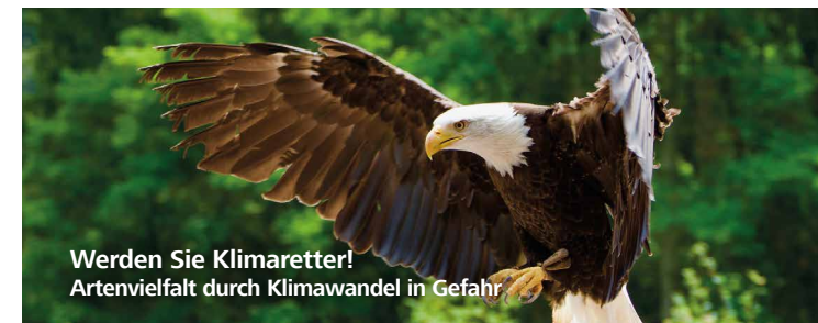
Werden Sie Klimaretter! Artenvielfalt durch Klimawandel in Gefahr

Der Verkehrssektor gehört zu den größten Belastungen für das Klima. Rund 146 Mio. Tonnen CO 2 haben Autos 2020 allein in Deutschland in die Luft geblasen. Elektroautos sparen CO 2 ein, sorgen für saubere Luft und weniger Lärm.